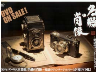
雑誌やTVなど様々な メディアで紹介されています