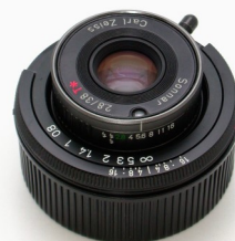
Contax T2 ゾナー38mmF2.8