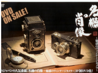
雑誌やTVなど様々な メディアで紹介されています