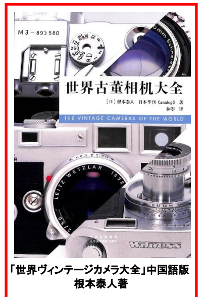
「世界ヴィンテージカメラ大全」中国語版 根本泰人著