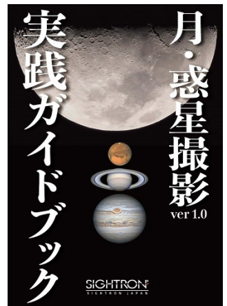
株式会社 サイトロン・ジャパン 2023年7月発行 監修 根本泰人